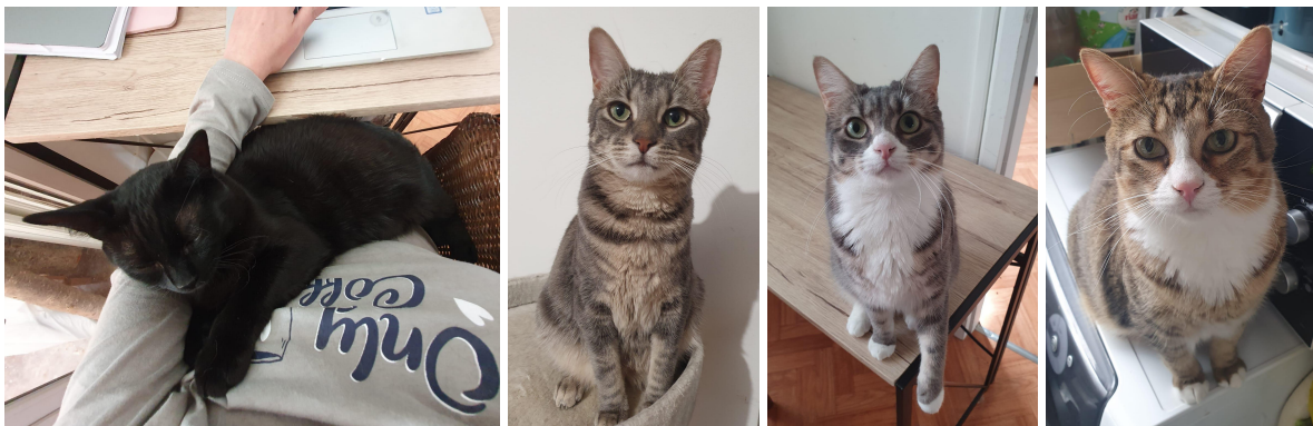
dans l'ordre BARAK - GRISETTE - LITTLE - RIKIKI aujourd'hui