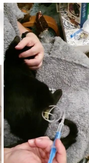
trappage des chatons - les chatons en famille d'accueil, avant le traitement - injection du traitement