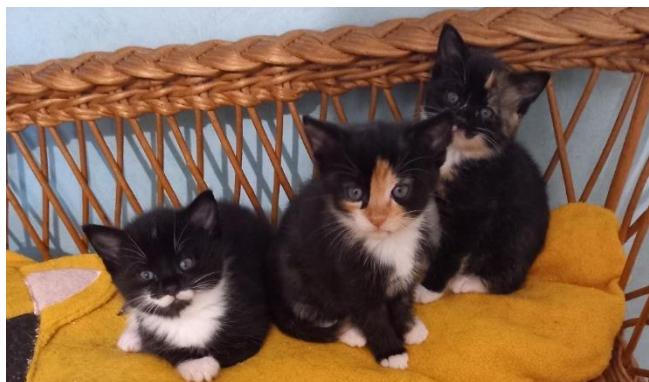
VELOURS, VIOLETTE et VIRGULE