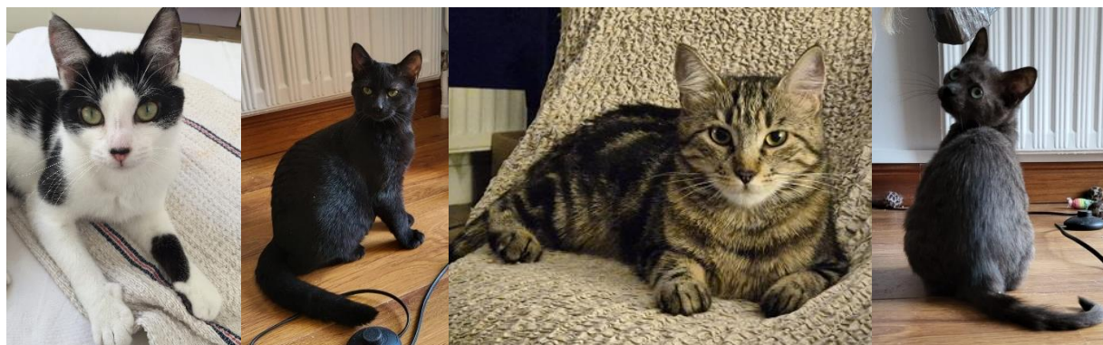
TWELVE, VIKING, SHAKIRA, WALOO