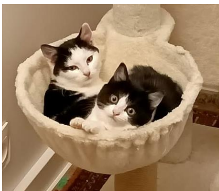
VELMA et WATSON, adoptés ensemble