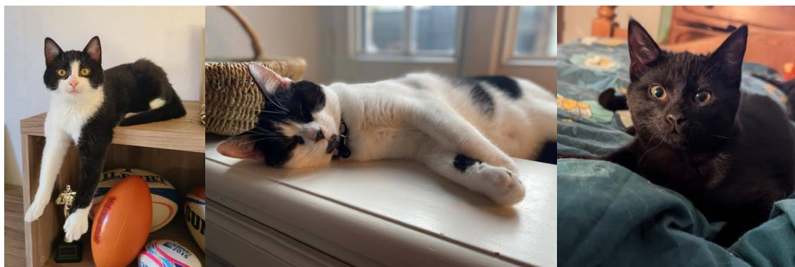
WINK, PASCAL, WARNING